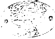
صفحة عنوان الجزء الثاني من نسخة الظاهرية